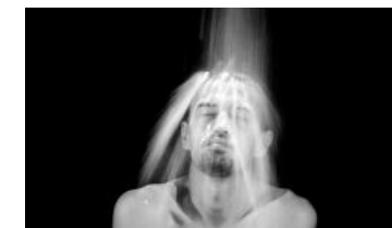
Baqer Ahmadi, Appearance and Disappearance , 2021 2-Kanal-Videoinstallation, 16:40/14:36 min, Ton Auflage 5/5. Im Auftrag des Vereins Treibsand Courtesy of the artist

JOIN@ENTER Dieses Angebot richtet sich an Besucher:innen jeder Altersklasse und wird je nach Ausstellungsthema adaptiert. Im Workshopraum gibt es immer etwas zu tun. Offen während der Museums-öffnungszeiten. Kostenlos.